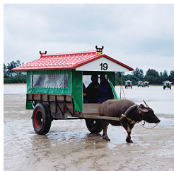
由布島への往復は水牛車でのもんぱりと

海拔1m周囲2.15kmの離れ小島。島へは約10分かけてゆっくり水牛車で渡る。島内には観賞用に植えられた約380本ものヤシ科植物や多くの種類の熱帯花がある。