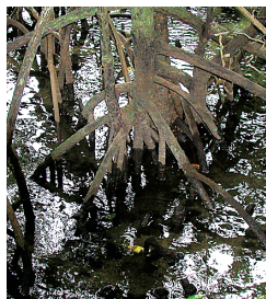
しっかりと根を張るマングローブ

仲間川は浦内川に次ぐ大きな川で、広い川の両岸にはマングローブが茂る。遊覧ボートに乗って、まさにアマゾンのような景観が楽しめる。