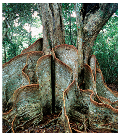
巨大な根が張り出すサキシマスオウノキ

奄美以南に自生する常緑高木。幹の周囲には波を打つような巨大な板根が張り出している。かつて船の舵やまな板などに使われていた。