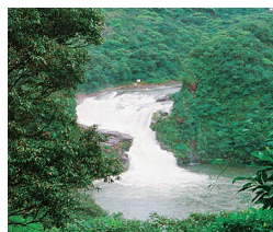
浦内川上流にあるマリウドウの滝

日本の滝百選に数えられる浦内川上流にある滝。落差は16mだが川幅は20mもあり3段に落ちる滝は水量も多く見ごたえがある。滝までは徒歩で行くが途中一望できる展望台がある。